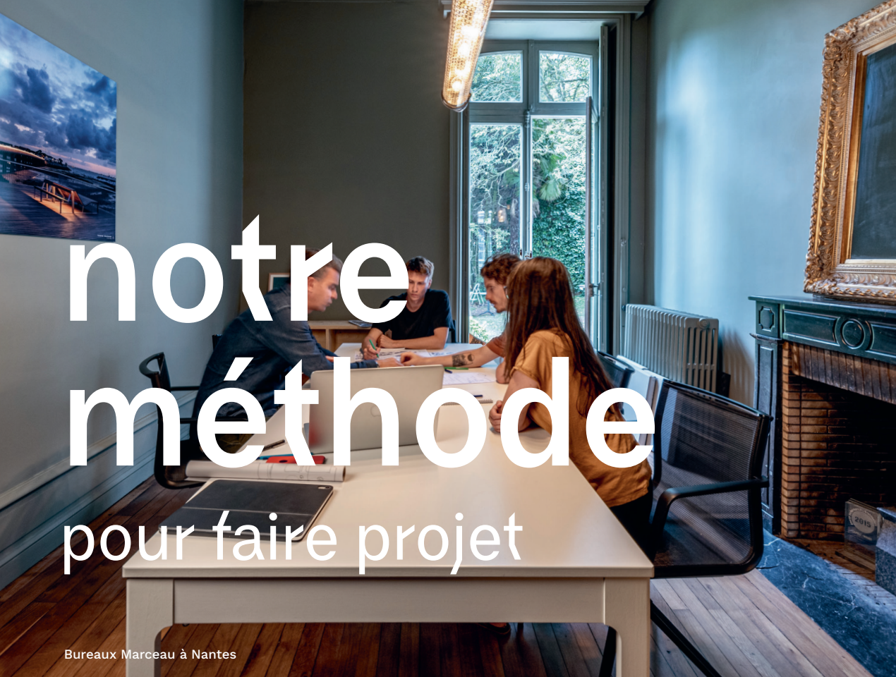
Bureaux Marceau à Nantes